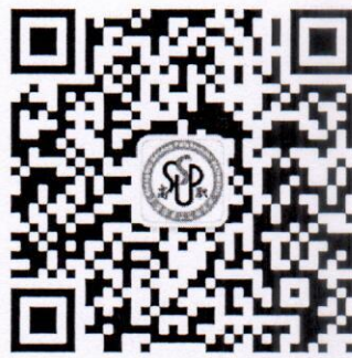
“上海基地二工大师资培训”公众号